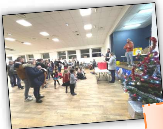
Tombola de Noël