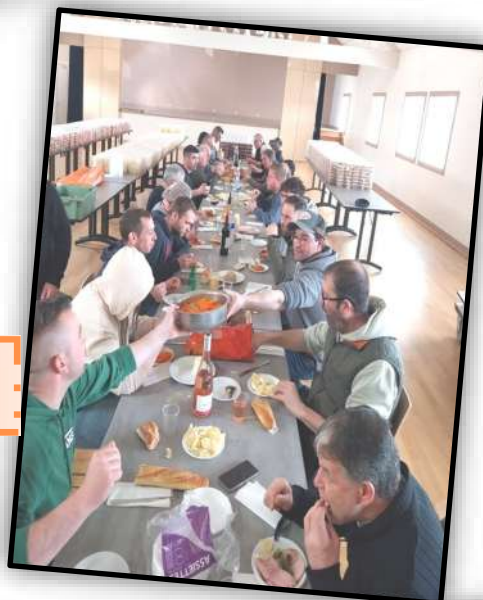
Repas de chasse