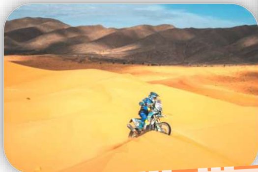
Championnat du monde des rallyes au Maroc