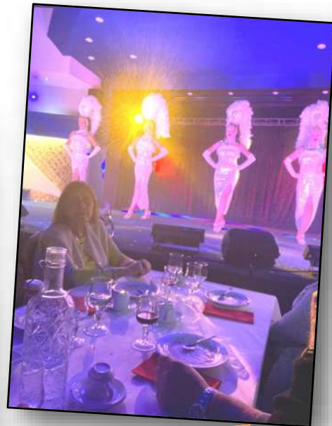
Spectacle de Noël : Muzillac