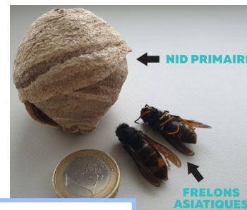
Nids de frelons asiatiques