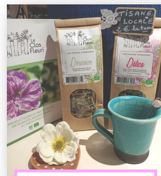
Les produits locaux

Changement des horaires d'ouverture. Du mercredi au dimanche de 11h à 15h et de 17h à 19h. Sur place ou à emporter. Le mercredi, le bar est ouvert jusqu'à 21h environ (ouvert durant la présence du camion pizza). Le jeudi, fermeture à 18h30.