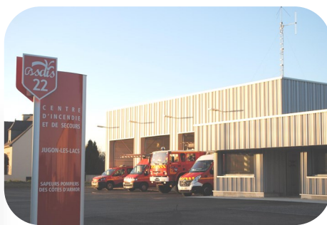
Caserne de Jugon-Les-Lacs